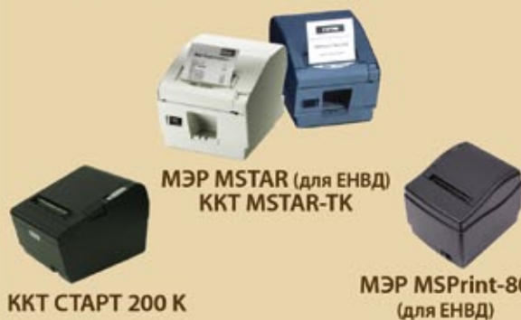
ККТ СТАРТ 200 К